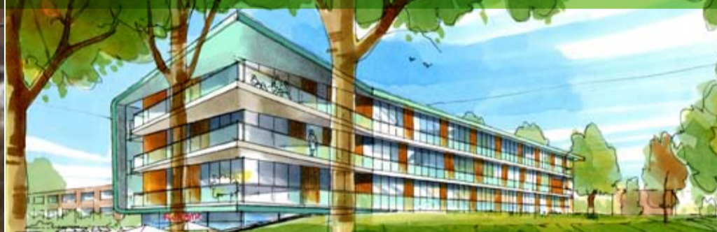
Een artist impression van de Nieuwbouw aan de Boddens Hosangstraat van FAME Architectuur & Stedenbouw.