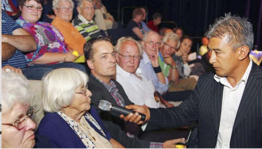
Een volle zaal met huurders in Amphion tijdens het huurdersdebat van 2009. Leefbaarheid was toen een van de gespreksonderwerpen.