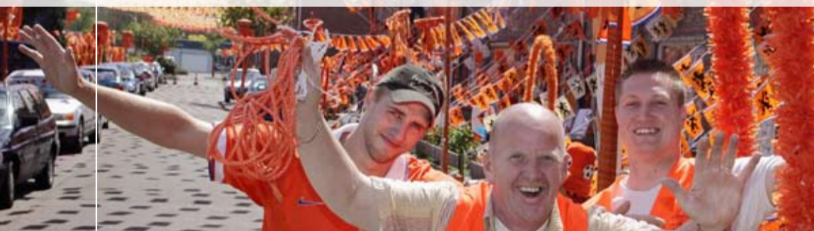
Bewoners van de Themansstraat in Doetinchem maken tijdens elk EK en WK er een feest van in hun straat.