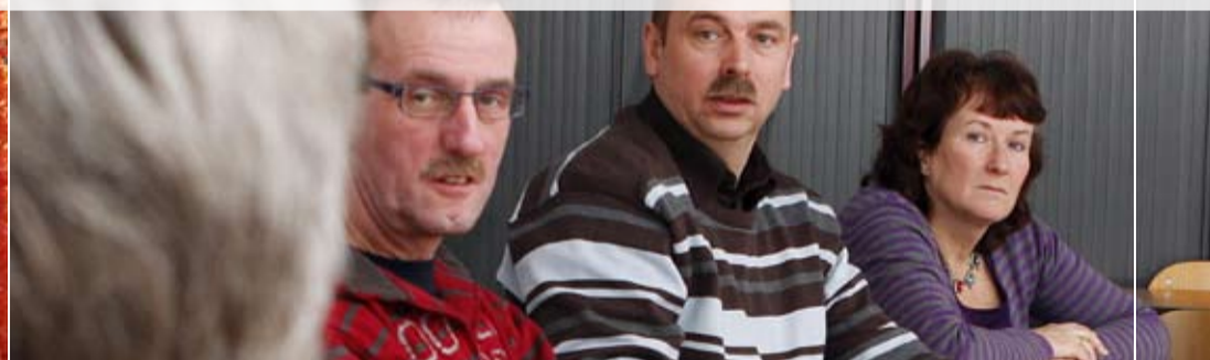
Bewoners van de wijk Schöneveld kwamen tijdens een workshop met tal van tips om het binnengebied te verfraaien.

Sité heeft dit jaar en volgend jaar in totaal 1,2 miljoen euro beschikbaar voor het stimuleren van leefbaarheid. Het geld wordt met name ingezet in buurten waar wij veel woningen hebben staan. De bedoeling is dat met name onze huurders er van profiteren.