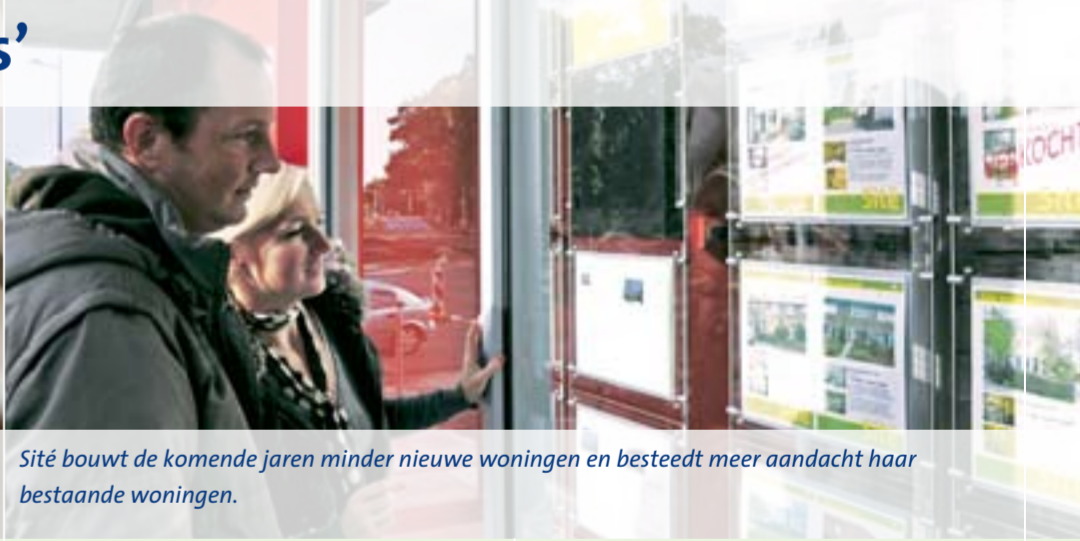
Sité bouwt de komende jaren minder nieuwe woningen en besteedt meer aandacht aan bestaande woningen.