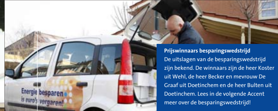
Bewoners van Bronckhorst hebben een brief ontvangen voor gratis energieadvies en een energiebox.

Meer info op www.lookkwartier.nl en www.vrijstaandwonenindoetinchem.nl .