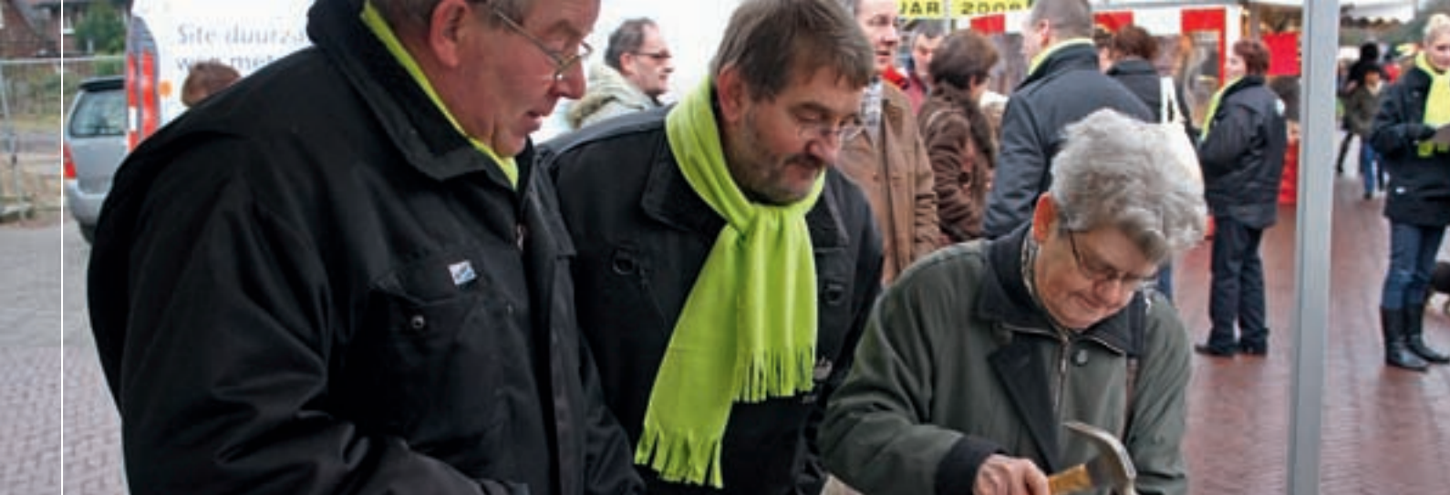
Bezoekers van de Sité-stand mochten met een hamer hun meningen en klachten over Sité op een schraag spijkeren.