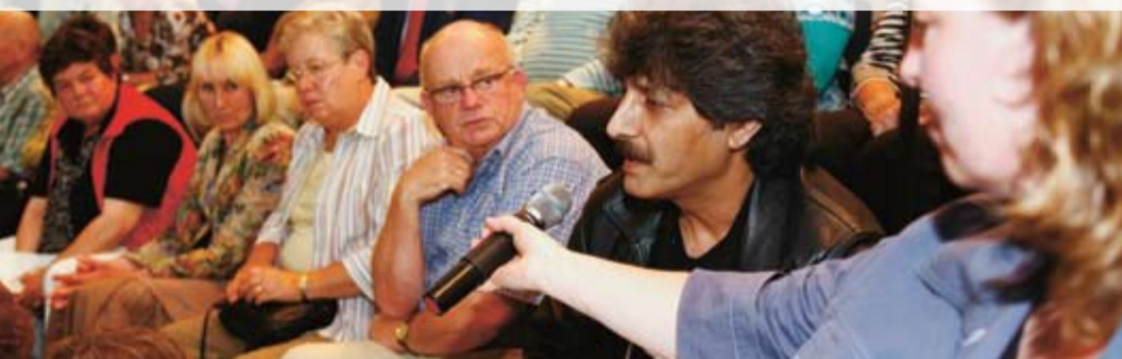
Een foto van het huurdersdebat, zoals dat op 11 juni voor tweehonderd Sité-huurders in Amphion werd gehouden.

Inspraak werkt! Samen met de gemeente gaat Sité in Doetinchem buurtconciërges aanstellen. Zij moeten de verrommeling in buurten tegengaan en worden de ogen en oren van de wijk. Daarmee komen we tegemoet aan klachten van huurders die wij in juni hoorden tijdens het debat DenkMeemetSité LIVE in Amphion. En aan de wens van veel deelnemers van het online klantenpanel www.denkmeemetsite.nl . Zij vinden de aanstelling van buurtconciërges een goede zaak, lieten zij in een enquête over leefbaarheid weten.